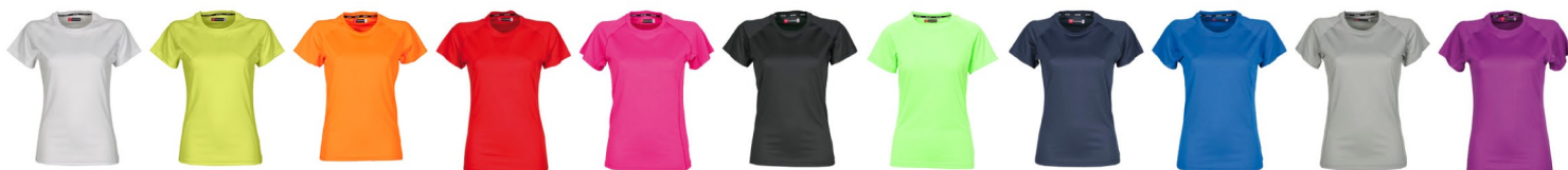
BIANCO GIALLO FLUO ARANCIONE FLUO ROSSO FUXIA FLUO NERO VERDE FLUO BLU NAVY BLU ROYAL GRIGIO CHIARO SUMMER VIOLET